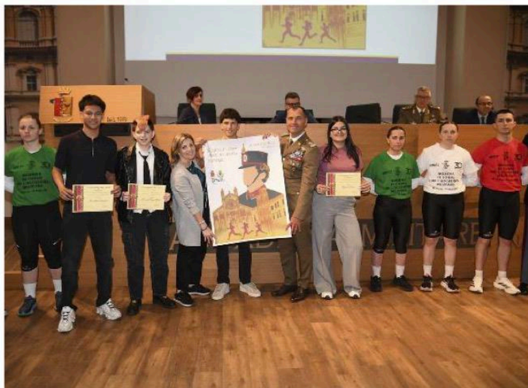
Ieri la presentazione della trentesima edizione di 'Modena di corsa con l'Accademia militare'