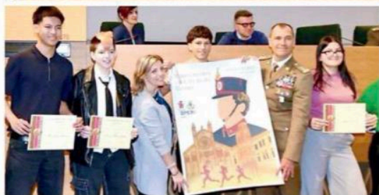
Qui sopra La locandina della corsa realizzata da Andrea Iscra del Venturi

4 o 10 chilometri. Il tracciato attraverserà la città fino a raggiungere il cuore dell'Accademia Militare, il suggestivo Cortile d'Onore. Le iscrizioni apriranno domani presso